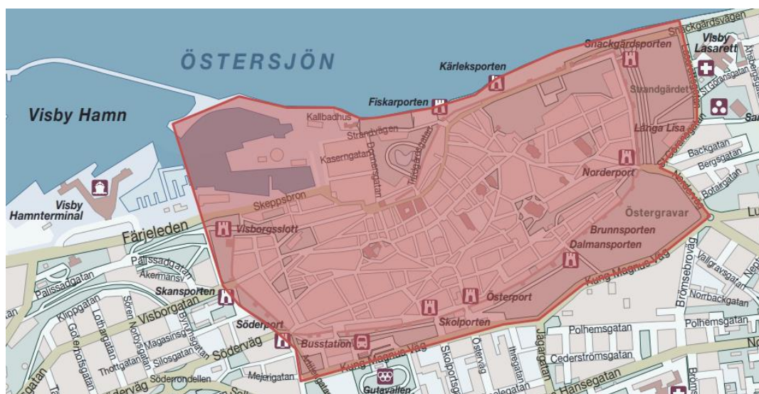
Figur 1 Typområde A