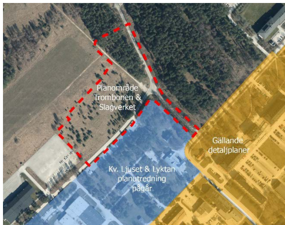
Bild 11 planområdets närbet finns gällande detaljplaner och pågående planutredningar

Området är inte detaljplanelagt. I sydöst gränsar det till ett pågående detaljplanearbete för Kv Ljuset & Lyktan. I öster angränsar området till detaljplan för Visby del av Visborg 1:1 (kasernområdet).