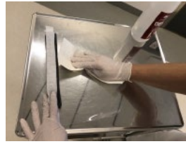
4. Börja med att desinfektera visirets insida.