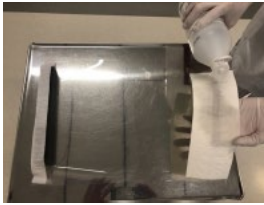
3. Lägg visiret på en plan yta som tål att desinfekteras. Blöt en duk med ytdesinfektionsmedel.