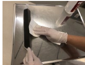
6. Desinfektera därefter visirets utsida.