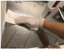
5. Lyft upp visiret medan bordsytan desinfekteras därefter läggs visiret tillbaka med insidan mot bordsytan.